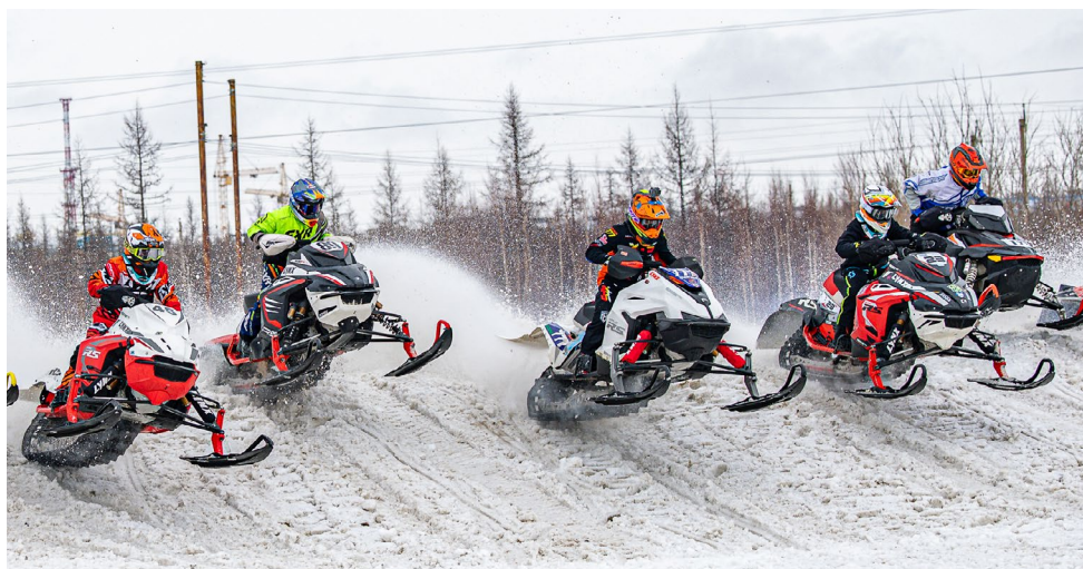
Старт и финиш – самые напряженные этапы заездов