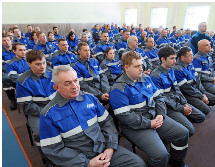
Встреча с работниками в вахтовом жилом комплексе «Сеноман»