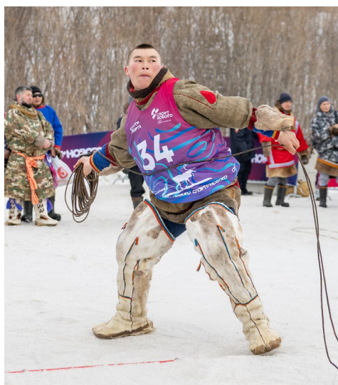
Энергия победы. Во время спортивных состязаний под ногами участников плавился снег