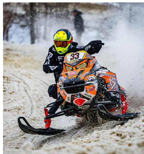
На крутых виражах