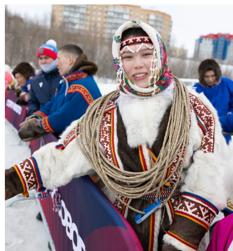
Девушки в национальных нарядах – украшение праздника