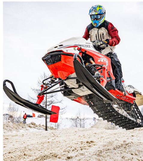
И совсем юные, и взрослые гонщики максимально выкладываются ради победы