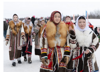
БОЛЬШЕ ЧЕМ СОСЕДИ На Дне оленоведа в Новом Уренгое стр. 8