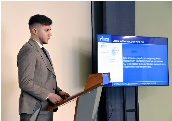
Регламент строгий. На защиту проекта – не более десяти минут. Далее – пятиминутная дискуссия

Наверное, в Управлении аварийно-восстановительных работ этой весной лед на пешеходных дорожках растает первым в городе!