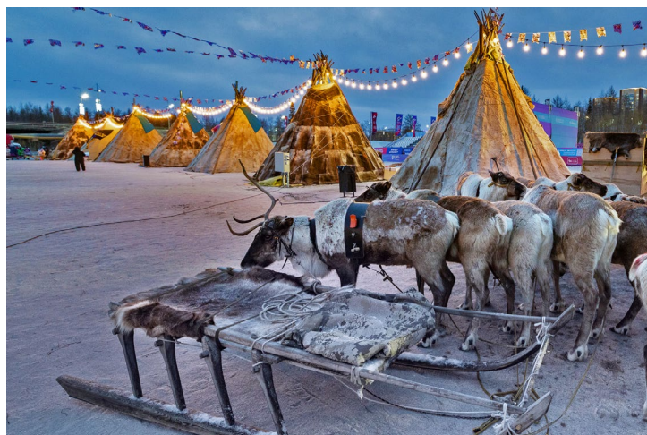
В этом году в Новом Уренгое установлен рекорд по количеству чумов – 33!

Все краски и эмоции Севера – в нашем фоторепортаже со Дня оленевода.