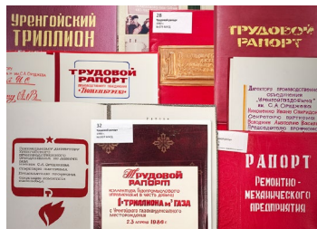
СИМВОЛЫ ТРУДОВЫХ ПОБЕД Как газодобытчики докладывали о своих достижениях стр. 4