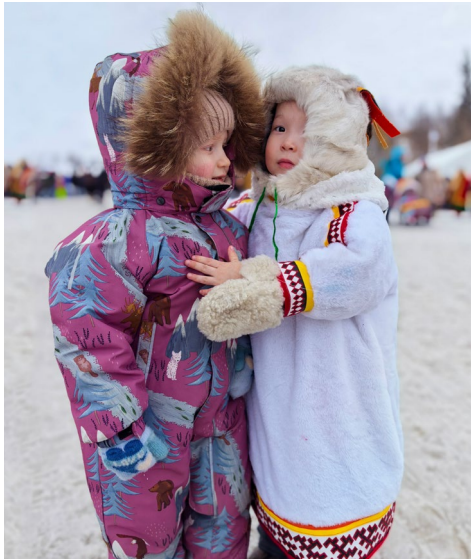
У девчонок – свои секреты