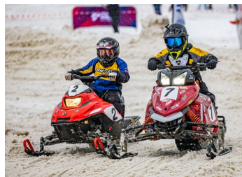
ВСЕГДА В ДВИЖЕНИИ Новые медали наших снегоходчиков стр. 7