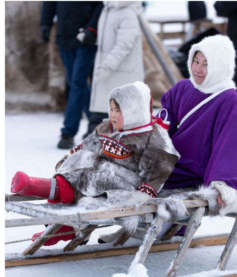
На нартах посидеть, себя показать

Подготовили Владимир БОЙКО и Ольга ГОЛУБЦОВА