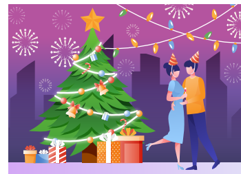
ВСТРЕЧАЕМ НОВЫЙ ГОД БЕЗОПАСНО! Полезная информация стр. 8