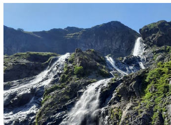
ТАМ, ГДЕ СЛИЛИСЬ КУБАНЬ И ТЕБЕРДА Любимые уголки России стр. 6-7