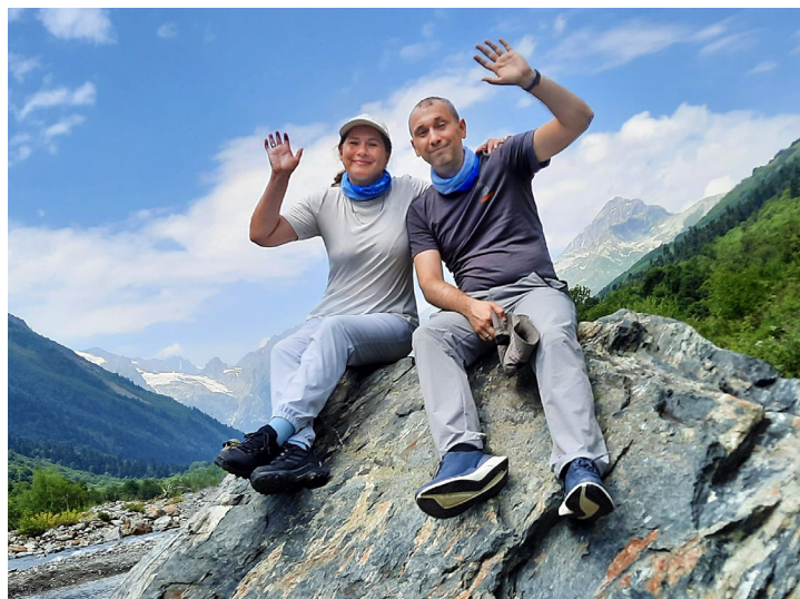
На привале. Пока еще полные сил