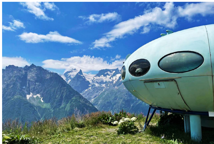
Коттедж горнолыжников «Футуро» появился здесь в конце 60-х годов.

Его автор – финский архитектор Матти Сууронен. В «тарелке» можно забронировать проживание