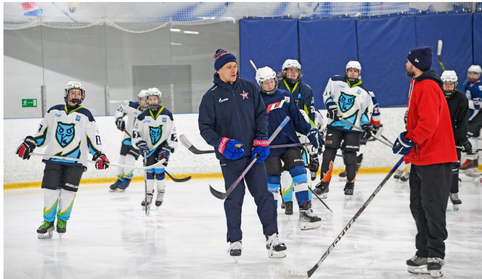
Мастер-класс для молодых спортсменов

Профессиональный хоккеист, защитник клуба СКА Никита ЗАЙЦЕВ посетил Новый Уренгой. В обширной программе пребывания мастера спорта России международного класса на северной земле нашлось время и для знакомства с газовой столицей и ее достопримечательностями, и для встречи с болельщиками и, конечно, для мастер-классов. Расскажем обо всем по порядку.