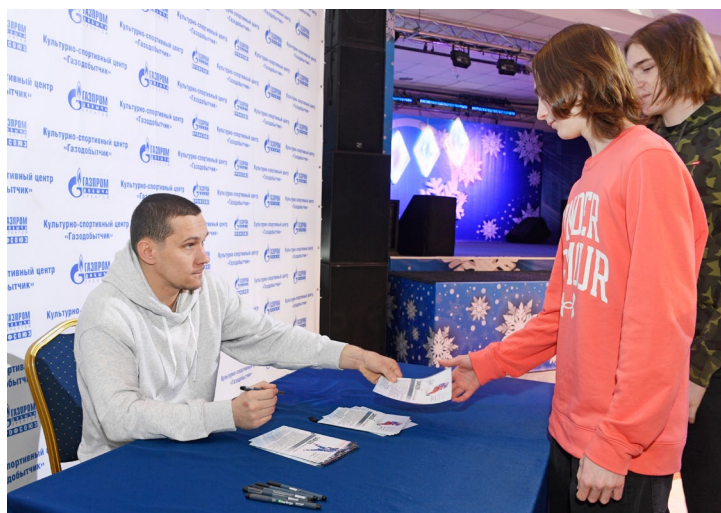
...и провел встречу с фанатами хоккея

Пожалуй, запредельной мотивации, бойцовским и лидерским качествам научить в полной мере на тренировках не удастся. Но всегда можно вдохновить личным примером, а на мастер-классе – еще и показать новые тактические и технические приемы, способы сделать себя и свою игру лучше. И такой возможностью не могли не воспользоваться юные воспитанники клубов «Факел» и «Факел-Контакт». Причем тренировочные сессии