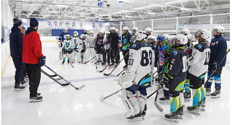
Газодобывающая компания предоставила молодым хоккеистам Нового Уренгоя уникальную возможность выйти на лед с игроком НХЛ и КХЛ

со звездным гостем растянулись на два дня – так поучаствовать в них смогло больше ребят из разных возрастных групп.