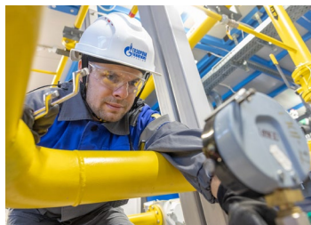
ПУТЬ НА ПЬЕДЕСТАЛ Лучшие в своем деле. Интервью по поводу стр. 2-3