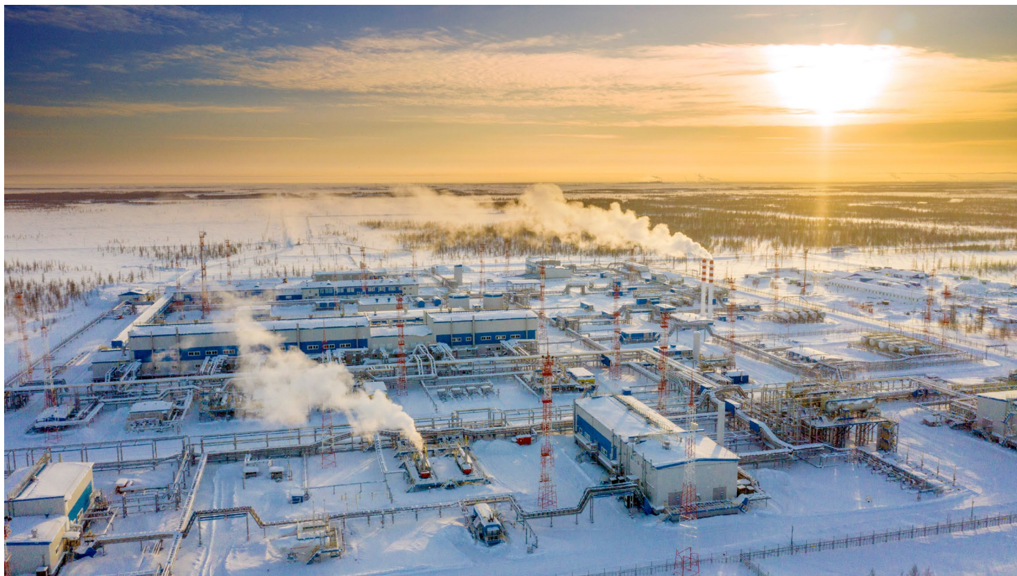
Газоконденсатный промысел № 21

Общество «Газпром добыча Уренгой» получило новый сертификат соответствия системы менеджмента качества требованиям ГОСТ Р ИСО 9001-2015.