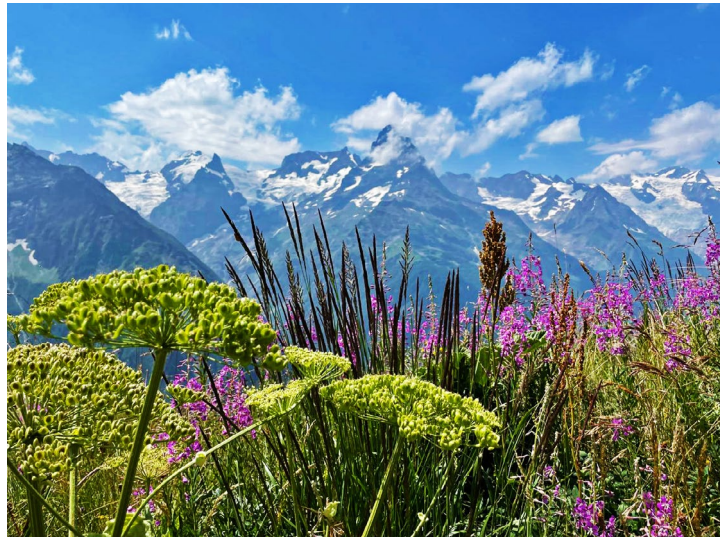
Поднявшись вверх по канатной дороге, можно прогуляться по альпийским лугам

Теплым утром первого дня, пока исключительно позитивная и энергичная гид Галина проводила инструктаж и раздавала палки для ходьбы, я разглядыва-